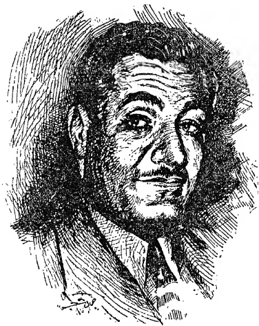
الرئيس جمال عبد الناصر