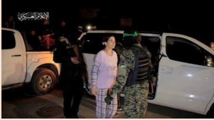
من العملية الأولى لتبادل الأسرى