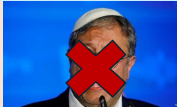
إيتمار بن غفير