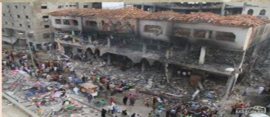
صورة المنكر النجاري في مرفح!